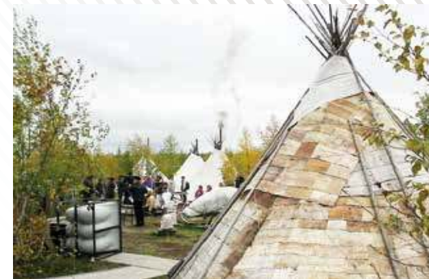
Туровый комплект, г. Салехард, 2003 год