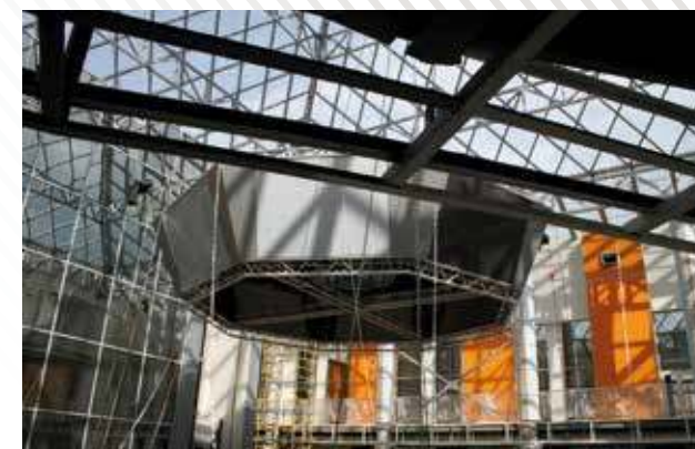
Западно-Сибирский Инновационный Центр Нефти и Газа, г. Тюмень, 2008 год