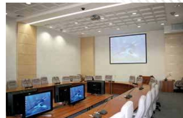
Западно-Сибирский Инновационный Центр Нефти и Газа, г. Тюмень, 2008 год