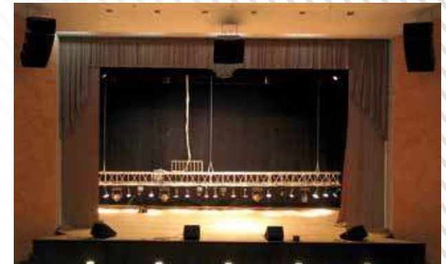
ДК, зрительный зал, г. Ялуторовск, 2008 год