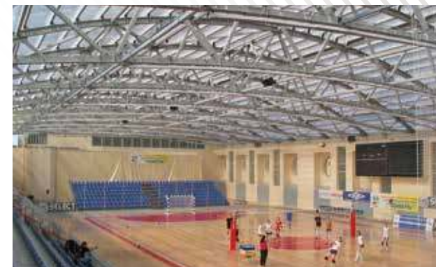
Стадион «Центральный», г. Тюмень, 2007 год