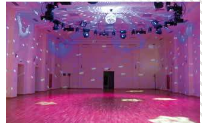
КДЦ «Октябрь», г. Ханты-Мансийск, 2009 год