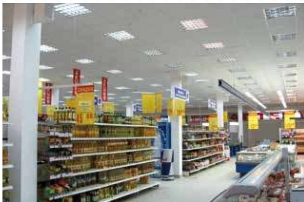
ТС «Монетка», г. Тюмень, 2007 год

Поставка комплекта уличного турового звукового комплекта