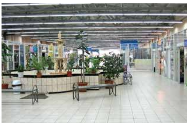
ТД «Тюменский», г. Тюмень, 2007 год