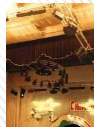
КСК «Геолог», г. Сургут, 2002 год