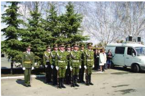
Администрация Тюменской области, г. Тюмень, 2003 год

Поставка всепогодных акустических систем для озвучивания боя курантов на башне мэрии Екатеринбурга