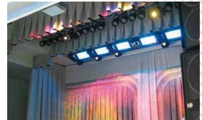
Актовый зал средней школы, г. Муравленко, 2009 год