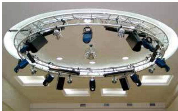
ДК, дискотечный зал, г. Ялуторовск, 2008 год

Проектирование механики сцены и установка конструкции