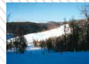
Горный курорт, г. Аджигардак, 2004 год