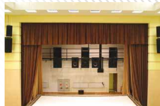
ДК «Русь», г. Зеленогорск, 2004 год

Звуковое и световое оборудование, механика сцены для концертного зала