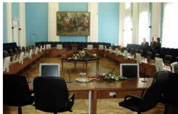
Администрация, г. Тюмень, 2002 год

Установка трансляционного оборудования в конференц-зале