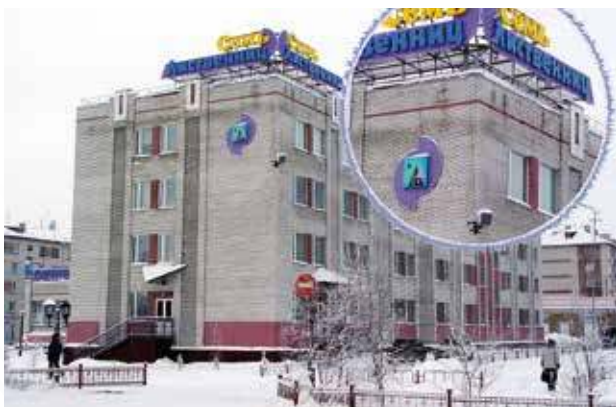
Системы уличного оповещения, г. Лабитнанги, 2005 год