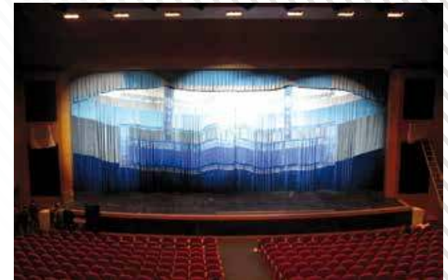
КДЦ «Наследие», г. Салехард, 2007 год