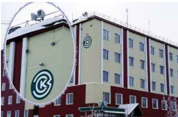
Системы уличного оповещения, г. Лабитнанги, 2005 год