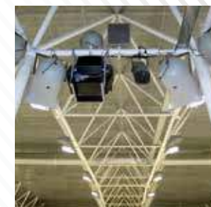
Ледовый дворец, г. Ялutorвск, 2007 год