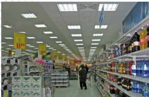
ТС «Монетка», г. Тюмень, 2007 год