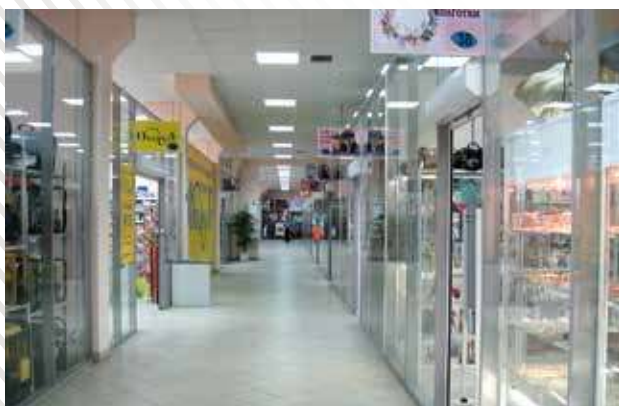
ТЦ «Континент», г. Тюмень, 2007 год

В число объектов ЗАО «ПФ Арсенал сервис», оснащенных системами оповещения, входят крупные торговые комплексы города Тюмени (ТЦ «Рентал», ТЦ «Солнечный», ТД «Столица», ТД «Тюменский», ТЗ «3000», ТС «Монетка», ТЦ «Континент»), Челябинска, Омска.