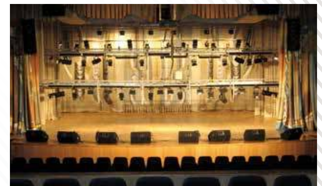
КДЦ «Октябрь», г. Ханты-Мансийск, 2009 год