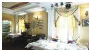
Ресторан «Потаскуй», г. Тюмень, 2003 год

Проектирование, поставка и монтаж звукового и светового оборудования