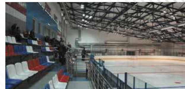
Ледовый дворец «Кристалл», г. Тобольск, 2011 год