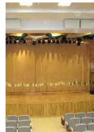
Актовый зал школы, г. Ноябрьск, 2007 год