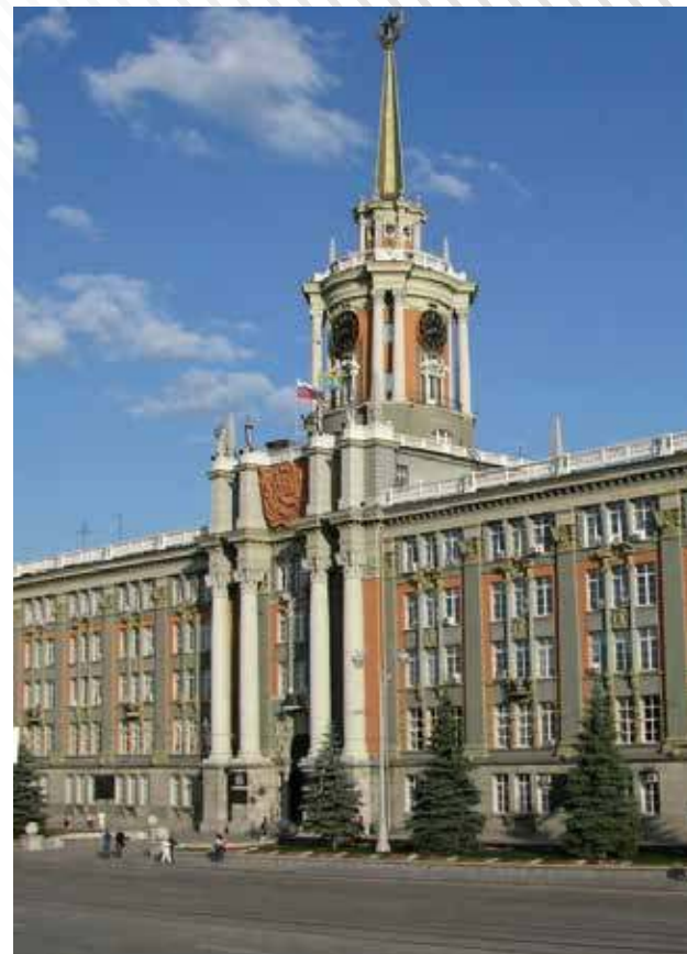
Здание Мэрии, г. Екатеринбург, 2006 год