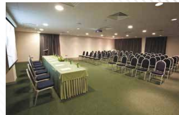
Отель «Ремезов», г. Тюмень, 2011 год