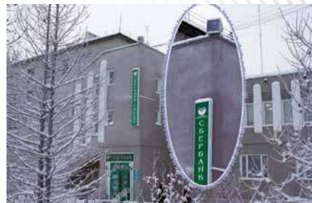
Системы уличного оповещения, г. Лабитнанги, 2005 год