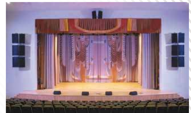
Дворец культуры, г. Заводоуковск 2011 г.